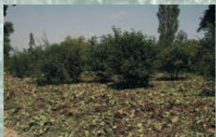
Plantations destinées à concurrencer la renouée