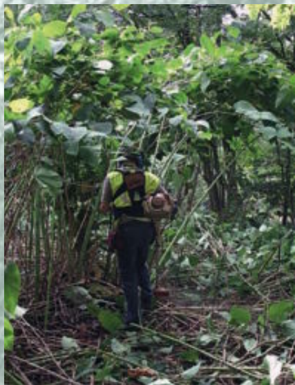
Fauche répétitive durant la saison de végétation